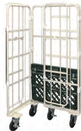
L型に折りたたみ可能。 (写真はKRC50J-PI)