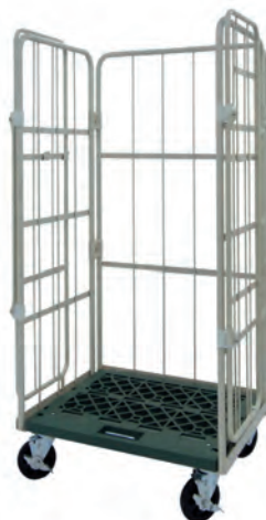
270度フルオープン可能!