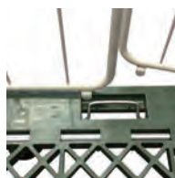
扉開き止め金具付。