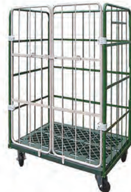
KRC90-Pは本体G、扉Iの2色仕様。