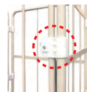
扉ヒンジは樹脂製。 不快なキーキー音防止。