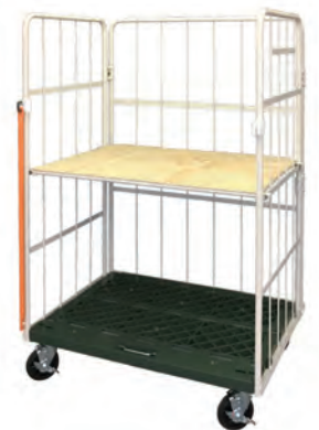
合板中間棚 取付例