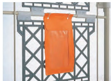
●ビニールポケット 180 × 265 (内寸155 × 200) ※A5サイズ用紙が入ります。

表中の数値は、規格品の自重 (kg) を表しています。 ※印は、ロット生産品となります。