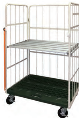
アルミ中間棚 取付例

表中の数値は、規格品の自重 (kg) を表しています。 ★印は、受注生産品となります。 ※印は、ロット生産品となります。