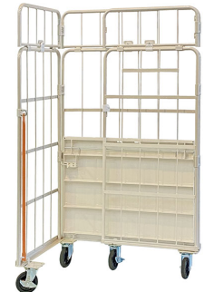
L型に折りたたみ可能。