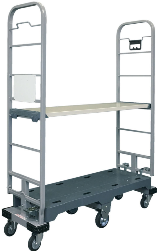
※中間棚・看板はオプションとなります。